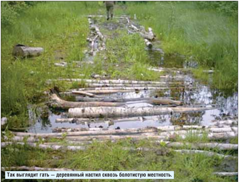
Так выглядит гать — деревянный настил сквозь болотистую местность.

Интересно, что логическая граница между владениями Чудова монастыря и княжескими владениями с одной стороны и Костинским землевладением, то есть Боховым станом, с другой существовала все эти годы и существует до сих пор. В XVIII веке при проведении Генерального межевания Яузские Мытищи и территория Лосиноя Острова были отнесены к Московскому уезду, а